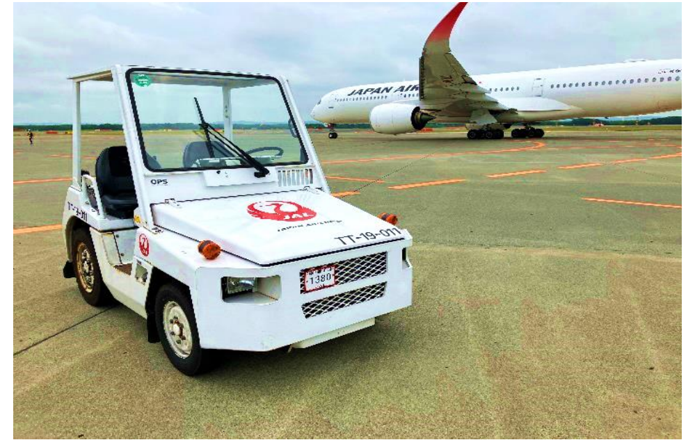
トーイングトラクター