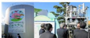
福岡県みやま市、佐賀県佐賀市 （2019年10月）